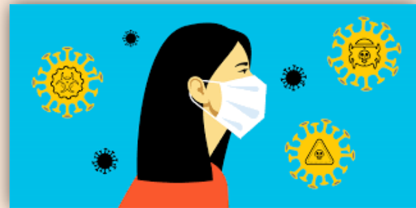
ACC Against COVID-19