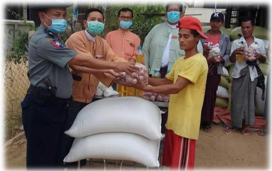
ACC Against COVID-19

နိုင်ငံတော်အစိုးရအနေဖြင့် ကပ်ရောဂါကူးစက်ပျံ့နှံ့မှု ထိန်းချုပ်နေစဉ်ကာလအတွင်း ပြည်သူများ ၏ စားဝတ်နေရေး အဆင်ပြေစေရန်အတွက် စားနပ်ရိက္ခာများလည်း ထောက်ပံ့ပေးလျက်ရှိ ပါသည်။ စားနပ်ရိက္ခာ ထောက်ပံ့ရေးအစီအစဉ်တွင် အမှန်တကယ်လိုအပ်နေသူများ လက်ဝယ်သို့ ရောက်ရှိအောင် ဆောင်ရွက်ပေးရန်မှာ ကြီးမားသောစိန်ခေါ်မှုတစ်ရပ်ဖြစ်ပါသည်။